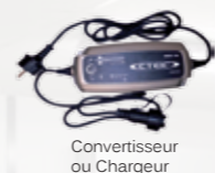
Convertisseur ou Chargeur