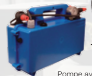
Pompe avec manomètre Connecteurs étanches Norme IP65 Variateur de débit