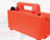
Batterie 12 V - 9 Kg - fusible 26 A/h - 3 h d'autonomie Sécurité décharge profonde Norme IP65